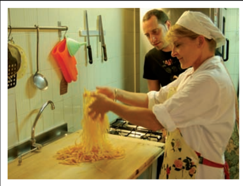
Pastas hechas a mano en Bologna.