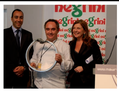
Reconocimiento a Ferrán Adrià en el 2008.