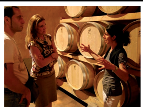
Bodegas Frescobaldi en Toscana.